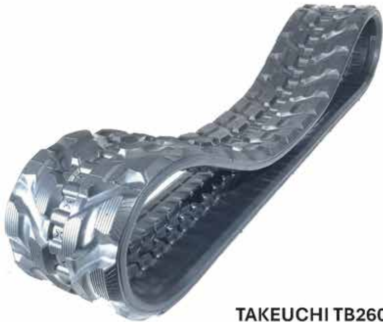
TAKEUCHI TB260 400x74x72,5RSW Gummikette

Bridgestone-Gummiketten sind bereits seit 1970 bei vielen namenhaften Maschinenherstellern in der Erstausrüstung. Insbesondere durch stetige Innovationen und hochwertige Komponenten wird eine herausragende Produktionsqualität erreicht.