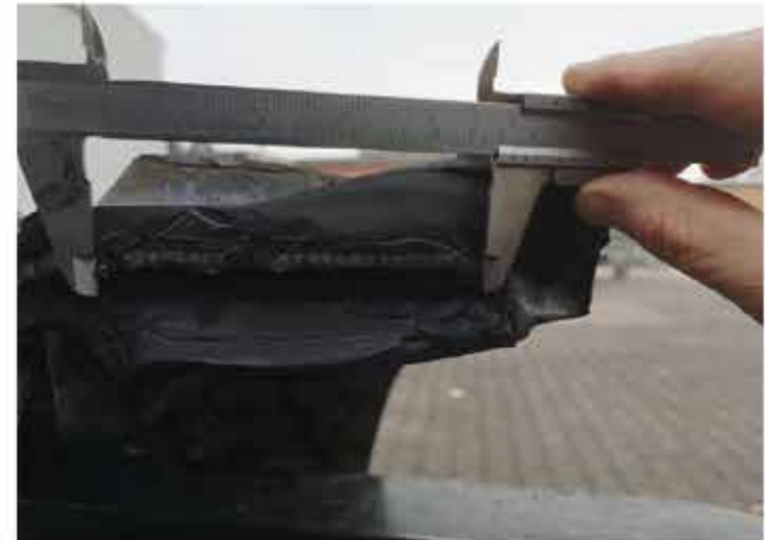
Wettbewerb 400x76x81W Gummikette - Nettogewicht 360,0kg 2x 28 Drahtseile mit 3,2mm Durchmesser

Eine reine Betrachtung des Gewichts wäre sicherlich zu kurz gegriffen. Auch die verbauten Komponenten sind ein wichtiger Faktor insbesondere dann, wenn Maschinen bei unverändertem Laufwerk immer schwerer werden. z.B. Vorgänger TB175 – ca.7,5to → TB290-2 – ca.8,5to Das zusätzliche Gewicht muss zwingend durch eine verstärkte innere Struktur abgefangen werden.