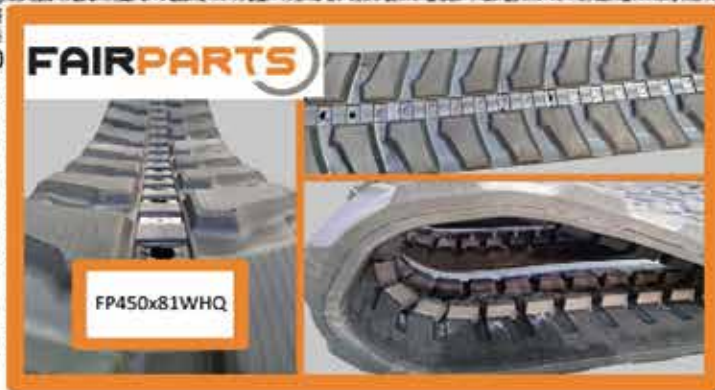
FP450x76x81WHQ Gummikette - Nettogewicht 358,0kg 2x 37 Drahtseile 3,6mm Durchmesser