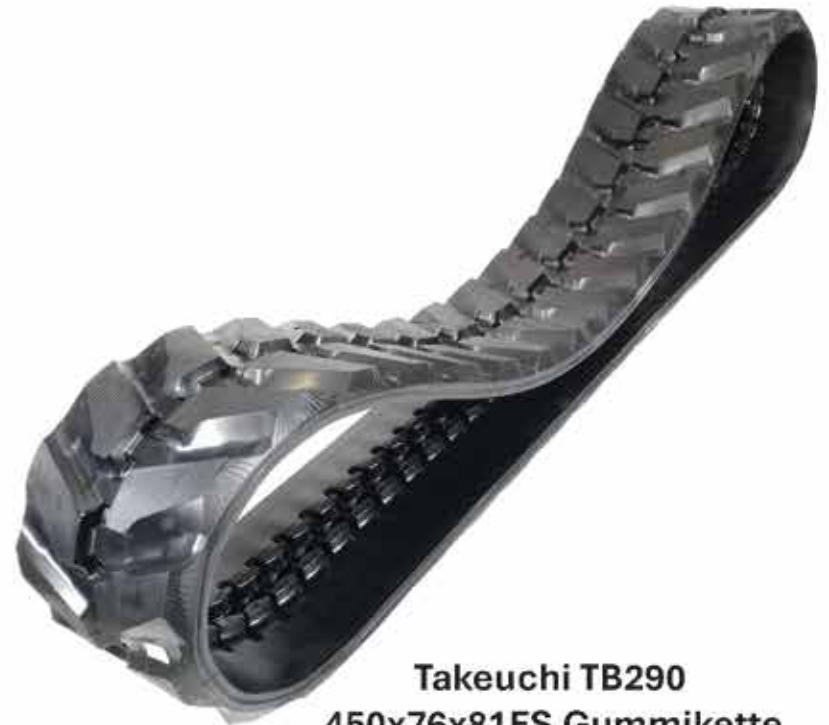
Takeuchi TB290 450x76x81FS Gummikette