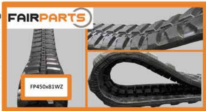
FP450x76x81WZ Gummikette - Nettogewicht 396,0kg 2x 32 Drahtseile 4,2mm Durchmesser

Eine reine Betrachtung des Gewichts wäre sicherlich zu kurz gegriffen. Auch die verbauten Komponenten sind ein wichtiger Faktor insbesondere dann, wenn Maschinen bei unverändertem Laufwerk immer schwerer werden. z.B. Vorgänger TB175 – ca.7,5to → TB290-2 – ca.8,5to Das zusätzliche Gewicht muss zwingend durch eine verstärkte innere Struktur abgefangen werden.