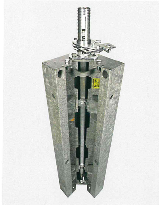
Framax-Ausschalecke I - einfach schnell