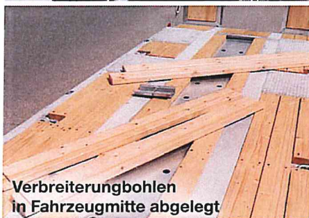
Verbreiterungsböhlen in Fahrzeugmitte abgelegt