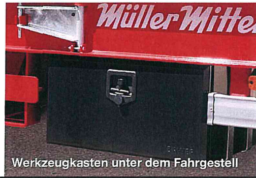
Werkzeugkasten unter dem Fahrgestell