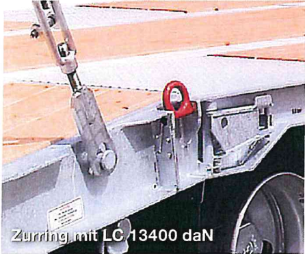
Zurrring mit LC 13400 daN