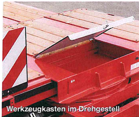
Werkzeugkasten im Drehgestell