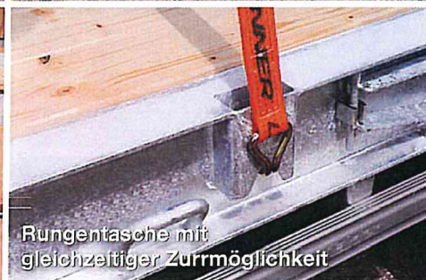
Rungentasche mit gleichzeitiger Zurrmöglichkeit

Individualität ist auch beim Oberflächenschutz geboten. Sie haben die Möglichkeit zwischen der umweltfreundlichen Behandlung mit 2K E-poxidharz-Grundierfüller und High Solid 2K Acryl-Decklack in Wunschfarbe oder einer Feuerverzinkung zu wählen.